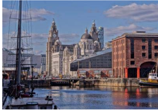
Les docks de Liverpool © shaunjeffers https://www.lonelyplanet.fr/article/5-raisons-daller-passer-un-week-end-liverpool

http://www.villes.co/royaume-uni/ville_liverpool_L26.html