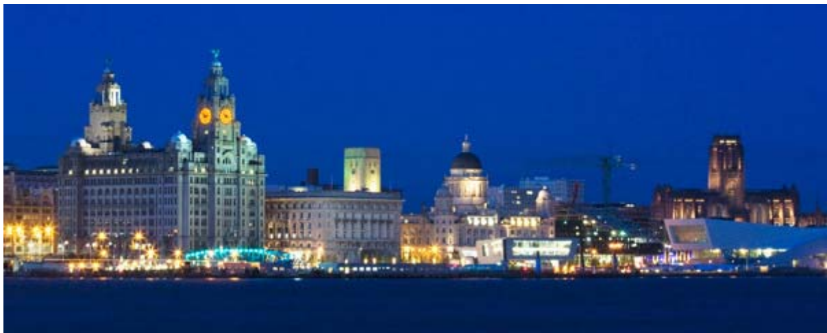
Le front de mer historique

http://www.villes.co/royaume-uni/ville_liverpool_L26.html