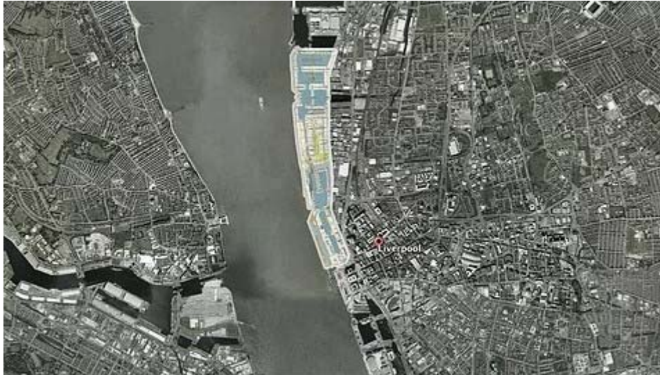
Figure 1 : La position de Liverpool Water à l'intérieur de la ville.

https://bergeronvaillancourt.wixsite.com/liverpoolwaters/contexte